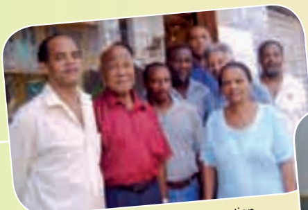
Le Conseil d'Administration