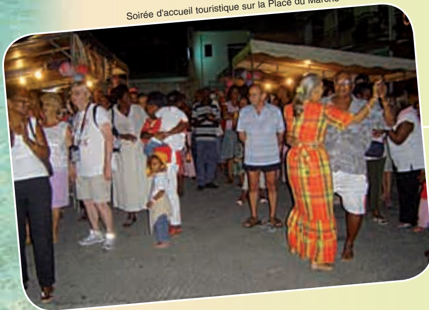
Soirée d'accueil touristique sur la Place du Marché

Animations variées sur le front de mer et des menus promotionnels proposés par les restaurateurs de la Commune.