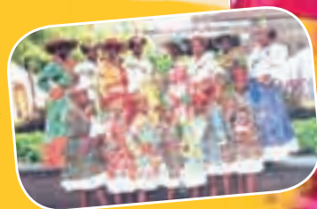
«Le Ballet Tchè Kréol : une partie de la troupe»

Cité Ti Mare Ex salle des fêtes «Le Moubin» Sainte Luce ☎ 0596 74.95.16 • 0596 62.56.05 • 0596 62.42.19